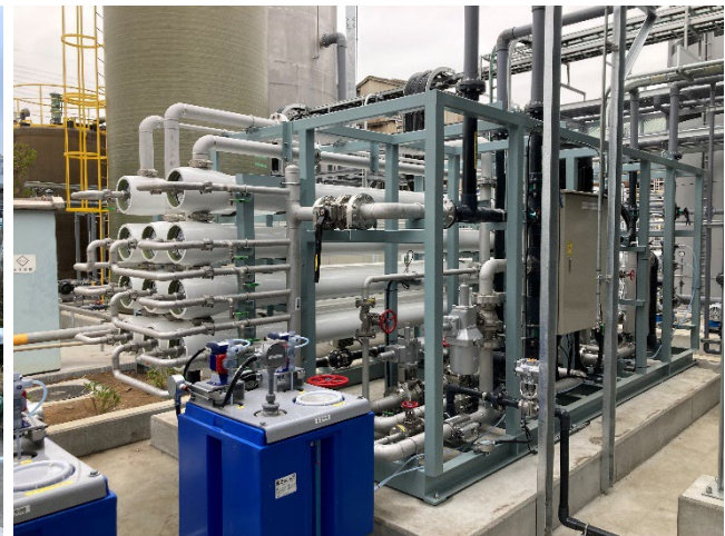
水のサイクルを可能にする排水回収装置（ROユニット）

東京ガスグループは、1985年から主に自グループの工場やビル向けに水処理製品の取り扱いを開始 *2 し、現在はその長年の経験やノウハウを活かし、お客さまの工場内の水処理設備の導入やコンサルティング等、工場向け水処理ソリューション *3 を展開しています。